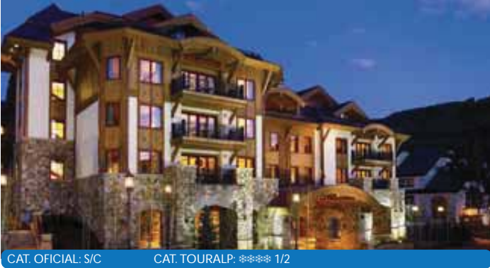
CAT. OFICIAL: S/C CAT. TOURALP: **** 1/2

Situado en pleno centro de Vail, a unos minutos andando de los remontes y rodeado por toda la zona peatonal con sus tiendas, restaurantes, galerías y lugares de ocio. Dispone de bar, 2 restaurantes, piscina climatizada y jacuzzis exteriores, gimnasio, sauna, baño turco, Sorrento Spa con vinoterapia, tratamientos faciales e hidroterapia, salas de eventos y