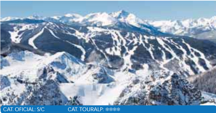
CAT. OFICIAL: S/C CAT. TOURALP: ****

Se encuentran en el barrio de "Lionshead", a pie de pistas y remontes, junto a una gran variedad de tiendas y bares-restaurantes y a 5 minutos del centro de Vail. Dispone de salón con chimenea, guardaesquíes con secadores para las botas, piscina climatizada, sauna y jacuzzi. Garaje y limpieza diaria incluidos en el precio. Todos los apartamentos cuentan con salón-comedor con chimenea de gas,