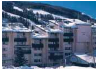
CAT. OFICIAL: S/C CAT. TOURALP: ****

Es un Hotel muy confortable, situado a 300 metros del centro de Vail, y a 400 metros de las pistas. Dispone de bar de ambiente con "Video-music", restaurante, salón, piscina climatizada, jacuzzi y sauna.