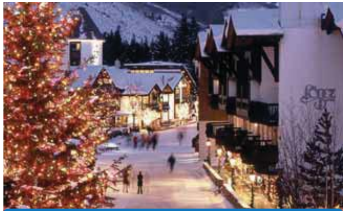
CAT. OFICIAL: S/C CAT. TOURALP: ****

Se encuentra situado a pie de pistas y remontes, en el mismo centro de Vail. Dispone de dos restaurantes, el Wildflower, uno de los mejores restaurantes de Vail y el Cocina Rustica Italiano, piano bar, discoteca, salas de congresos y reuniones, piscina climatizada,