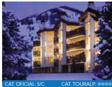
CAT. OFICIAL: S/C CAT. TOURALP: ****

Situado en pleno centro de Vail Village, junto al río y el famoso puente cubierto de Vail, a unos minutos andando del Telesilla "Vista Bahn". No dispone de comedor y los desayunos se sirven directamente en la habitación. Dispone de recepción, bar, piscina climatizada y jacuzzi exteriores, gimnasio y librería.